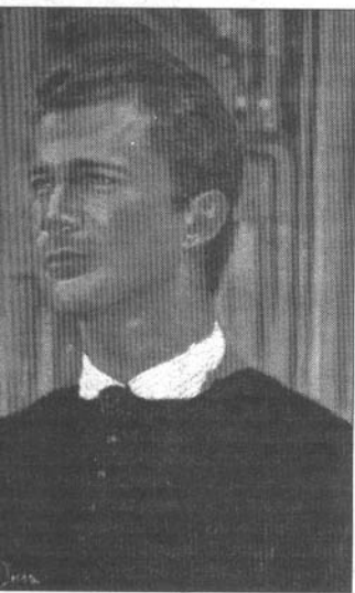
on Felipe de Borbón, Príncipe de Asturias de Esther Insa

La muestra está compuesta por personajes que pertenecen al imaginario colectivo de nuestra sociedad, mitos del cine de todos los tiempos, que interpreta captando momentos de películas, fotografía, gestos reconocibles, a